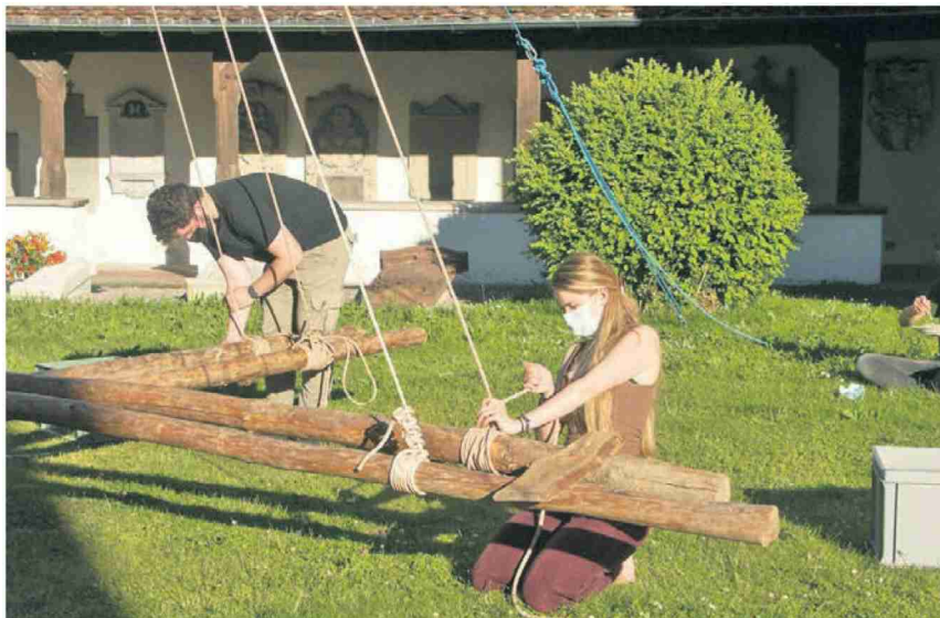
Die Cevi baute ein Holzkarussell.